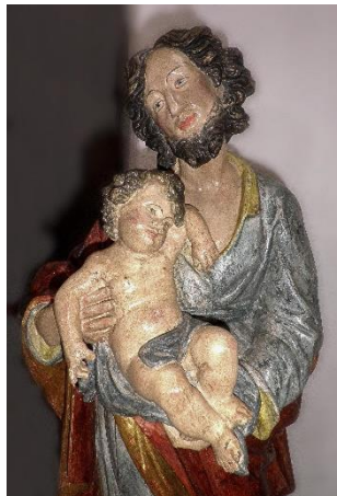
Hi. Josef mit Jesuskind

18:30 h Ro Hi. Messe anschl. 2- Std. Anbetung